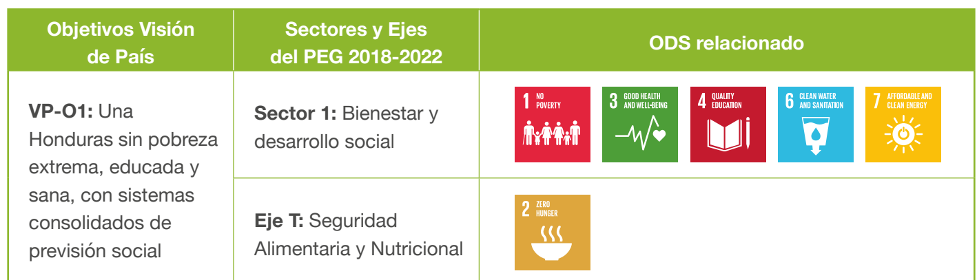
Figura 1. Relación de los ODS con la Visión de País y EL PEG 2018-2022

La vinculación de los ODS con el SNP se realiza a través de la Ley para el establecimiento de una Visión de País y la Adopción de un Plan de Nación para Honduras (2010-2038) y el Plan Estratégico de Gobierno (PEG) 2018-2022, con respecto a los objetivos sectoriales de mediano plazo, incluyendo subsectores y ejes transversales.