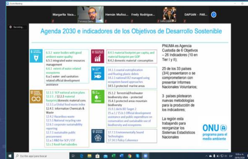
Taller sobre gobernanza e indicadores SIA Paraguay | Mayo 2020