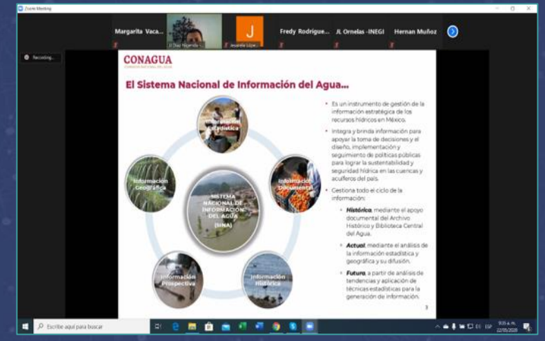
Intercambio de experiencias DO & MEX Paraguay | Mayo 2020