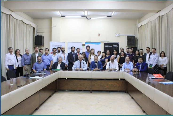
Misión Paraguay - Taller inicial Febrero 2020